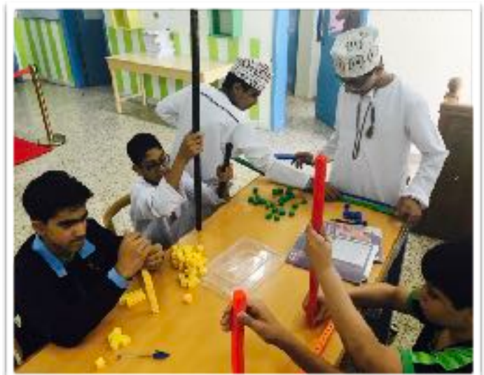
Learning about Ratio

I'm excited as it means that our students will have better opportunities throughout the year to really grasp Maths. We will continue with the MyMaths a precious tool to assist your children with their maths.