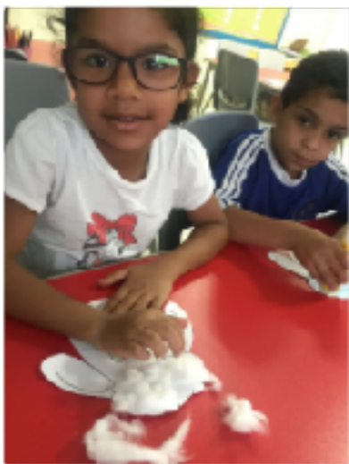
Eid-ul-Adha craft - making a sheep mask.