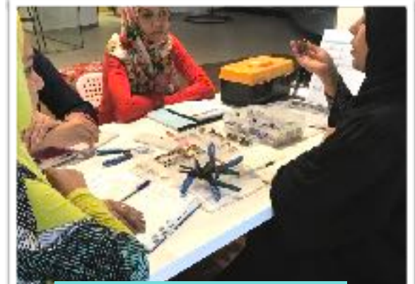
Meeting with EV trainer about the extra ICT curriculum

Please feel free to contact me or email me