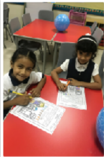
First day of school colouring page