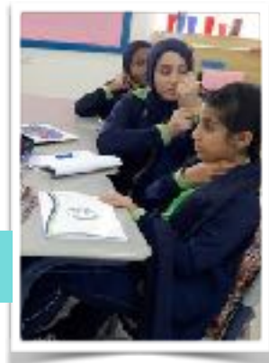
Measuring the pulse