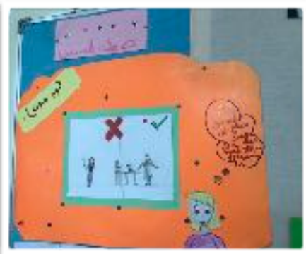
من أعمال الطلاب