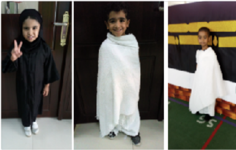
Hajj commemoration at school.