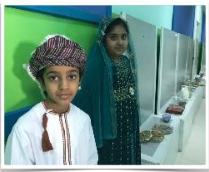
Who we are.