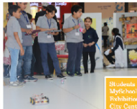
Students at MySchool TP Exhibitions in City Center 2017