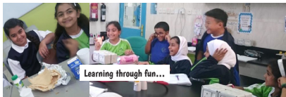
Learning through fun...