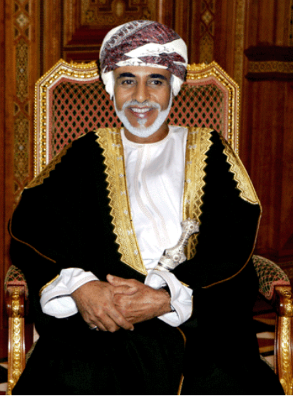
حضرة صاحب الجلالة السلطان قابوس بن سعيد المعظم