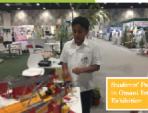
Students' Participation in Omami International Exhibition