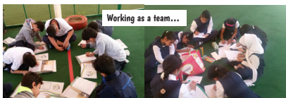
Working as a team...