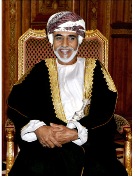
His Majesty Sultan Qaboos Bin Said