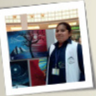
هدأفنا رسم الیسمة!